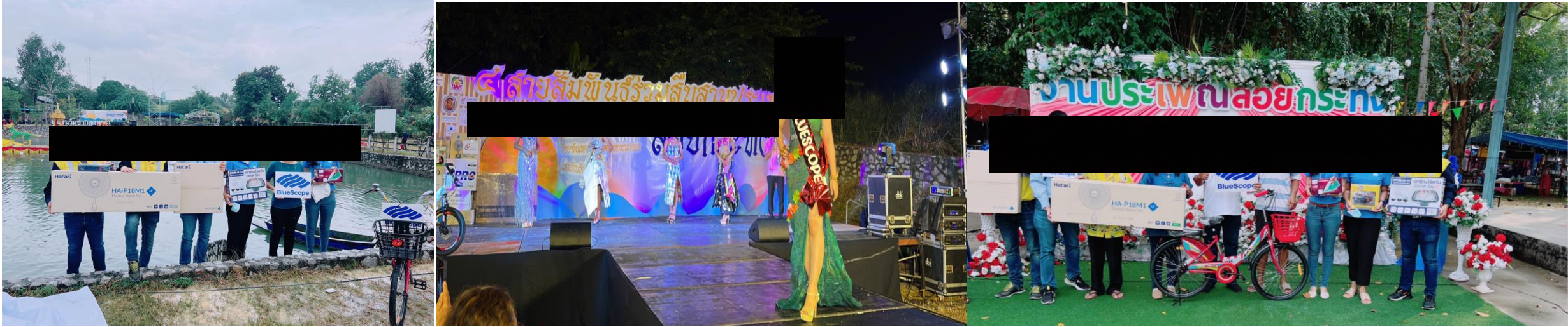
Event : Support activity Loy kra-tong festival to community and join miss grand recycle contest with community Date: 8 NOV 2022