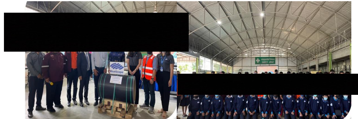
Event : Support coil for education and set up classroom to teach roof and wall installation to Rayong technical students. Date: 11 Sep 2022