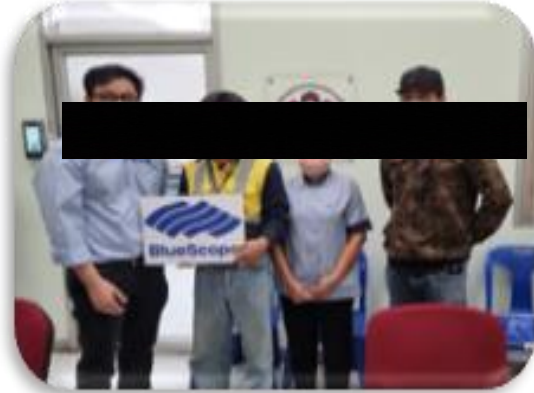
Event : Blood donation with local community and IEAT Date: 21 Jul 2022