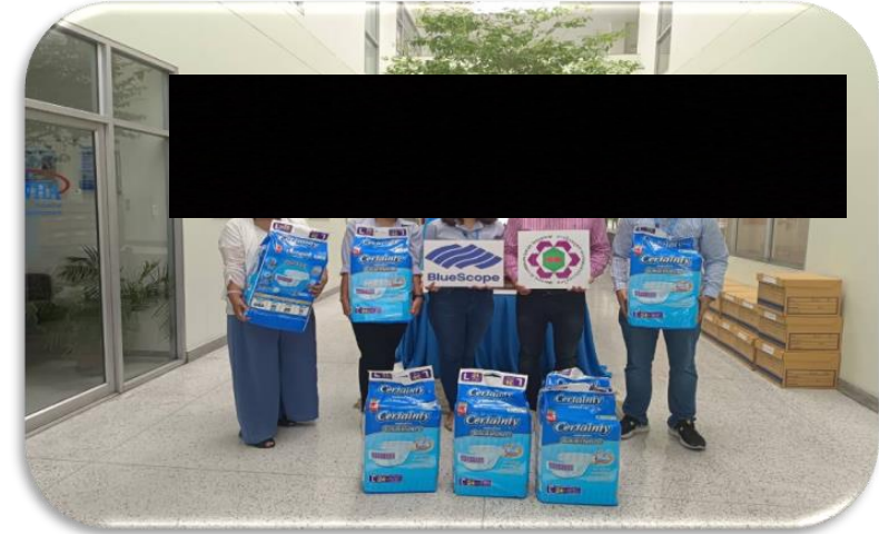
Event : Support equipment for bedridden patients in the rayong province Date: 11 Jul 2022