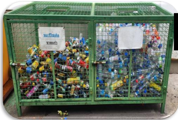
Event : Join to donate recyclable bottle to the community waste bank. Date: 11 Jul 2022