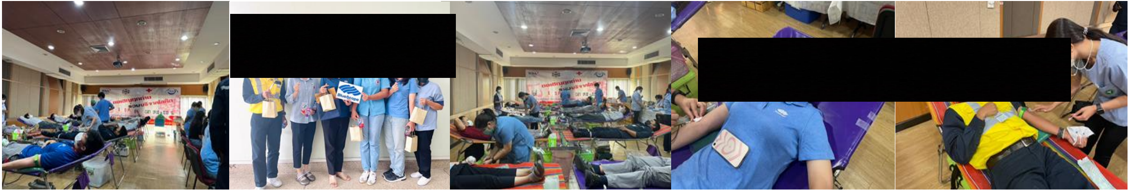
Event : Blood donation with local community and IEAT Date: 1 DEC 2022